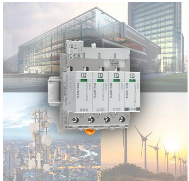
All Electric Society 환경에 대응하는 전기 시스템 안전 솔루션, Safe Protection Plus(SPP)

특히 스파크 갭 기반 Type 1 SPD의 후속 전류(line follow current) 억제 능력을 보다 폭넓게 고려한 점은 매우 중요하다.