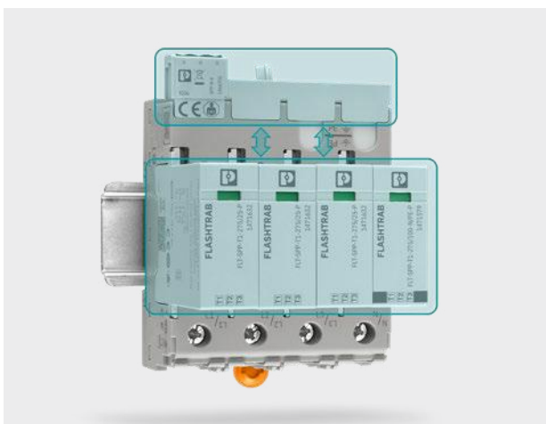
안전/보호 초저전압 보조 회로 보호를 위한 이중·강화 절연

결함 또는 과부하 상태의 SPD로 인해 발생할 수 있는 위험을 방지하기 위해, EN/IEC 61643-01은 SPD의 단락 시 동작에 대한 포괄적인 시험을 규정하고 있다. 이번 개정에서는 운용 안전성을 더욱 높이기 위해 관련 요구사항이 크게 강화되었다.