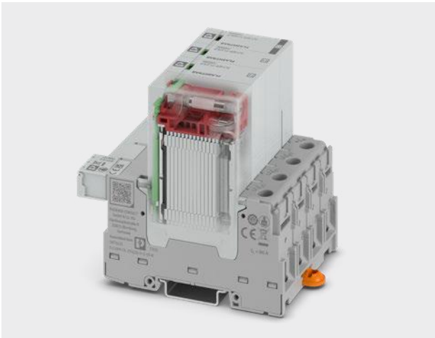
강화된 Type 1 SPD 요구사항에 부합하는 차세대 멀티-극 스파크 갭 기술

기존 EN/IEC 61643 표준에서는 스파크 갭 기반 타입 1 SPD의 후속 전류(line follow current) 억제 능력을 규정된 최대 낙뢰 전류 진폭( I_{IMP} ) 조건에서만 입증하면 충분했다.