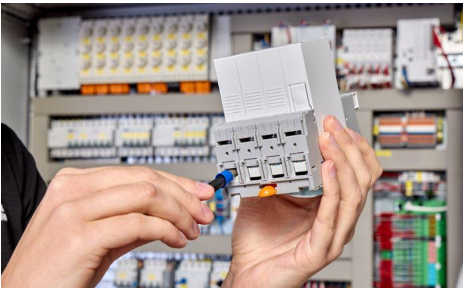
SPP(Safe Protection Plus) 제품군 확장된 공기 절연 거리·연면 거리 강화된 접촉 보호 및 오배선 보호

서지 보호 장치(SPD)는 최소 오염도 2를 충족하도록 설계되어야 한다. 이는 일반적인 주거 환경이나 밀폐된 제어반 내부 설치에는 충분하다. 반면, 제어반이 항상 닫혀 있다고 보장하기 어려운 산업 환경에서는 오염도 3을 충족하는 SPD가 보다 안전한 선택이 된다. 다만, 이 경우 연면 거리 요구사항은 상당히 증가한다.