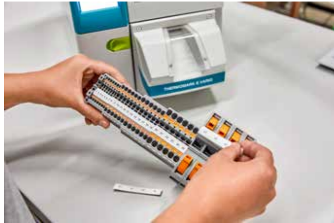
Opmærkning af hele klemrækken med blot to materialer

implementeres – uanset antallet af forskellige delinger. Takket være materialets innovative geometri har brugeren den fordel, at materialet passer perfekt i mærkningsrillen. Derudover kan individuelle mærker meget nemt deles langs perforeringen og klikkes på plads.