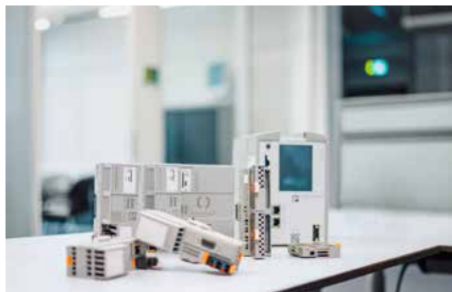
PLCnext Control, venstrevendte udvidelsesmoduler, I/O-systemer og software som del af PLXnext Technology

Det er ikke kun produktionen af brint, som kontrolleres fra styringen i containeren. Niveauerne i tankene skal også overvåges og forsyningen af elektrolytter skal reguleres. Ventilatorer, ventilation og forbehandling af vand skal kontrolleres, og elektriske belastningsstyringer og sikkerhedsrelaterede applikationer, inklusiv nødstop, skal sikres. De tilhørende opgaver kan håndteres af PLCnext Technology, fordi moderne processer har en åben kontrolplatform. Løsningen fra Phoenix Contact understøtter også vedligeholdelseskoncepter baseret på diagnosesignaler. Udover hardware til kontrol anvendes Phoenix Contacts Ex beskyttelseskomponenter i containerens styretavler. De omfatter egen-sikre I/O moduler med tilslutningsmuligheder til sensorer og aktuatorer op til zone 0.