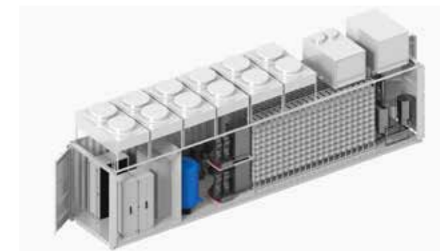
Phoenix Contact muliggør overvågning, automation og digitalisering af elektrolysatorer med de tilhørende processer og systemer

De første producenter er i gang med at udvikle brint-producerende elektrolysatorer som containerløsninger, hvor den tidligere individuelle fremstillingsmetode erstattes. Inden for rammerne af et modulært design er det muligt at forbinde disse standardsystemer for at etablere gigawatt anlæg. Effektiv masseproduktion af containere er kun mulig med industrielle produktionsmetoder. Leverandører af tilslutnings- og automationsteknologi, der ligesom Phoenix Contact dækker kravene i både pilotfasen og masseproduktion, tilbyder hjælp og rådgivning til udvælgelse af komponenter. Derudover leverer de service til alle faser af udvikling, design og software og rådgiver om processikkerhed.