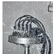
防塵・防水試験 IP65 / 67