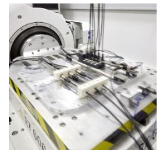
振動・衝撃試験 10~500Hz、50m/s 2