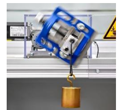
回転試験 360°回転、荷重13.7N