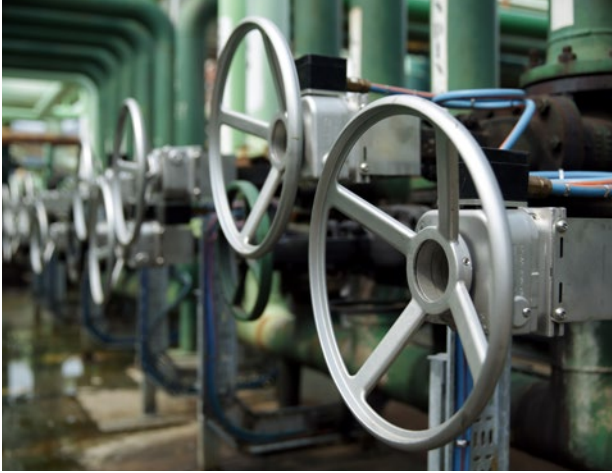
Damit sich Anlagenfehler frühzeitig erkennen lassen, werden die Ventile auch zukünftig manuell betätigt

Flüssigkeiten und Gase von einer der definierten Quellen an das ebenso festgelegte Ziel befördert werden. Die kostspielige Kontamination verschiedener Produkte lässt sich also sicher vermeiden. Außerdem reduziert sich die Belastung der als Field Operator tätigen Mitarbeitenden deutlich, weil die Routen für den Materialtransport konfiguriert, gesteuert und kontrolliert werden können.