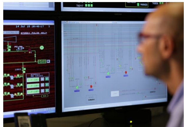
In der Leitwarte lassen sich die Routen für den Materialtransport konfigurieren, steuern und überwachen

Der Leitwarte liegen die Daten zu Ventilstellungen, Leitungsdrücken und Pumpenstation nun kontinuierlich vor. So können der Materialtransport durch die Leitungsnetze zentral überwacht sowie