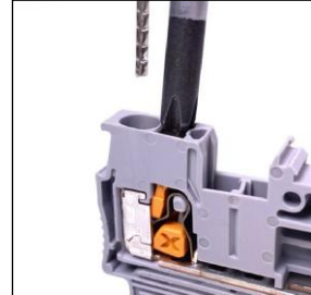
4. 電線リリース 専用工具不要でプラスドライバーでも作業可能