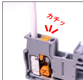
2. カチッと接続完了 カチッという音で配線が完了したことを実感