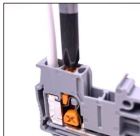
3. ボタンを押し込む ボタンがロックされるまでしっかり押し込む