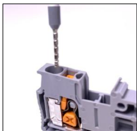
1. 電線を奥まで入れる プリテンションされた挿入口に電線を奥まで入れる