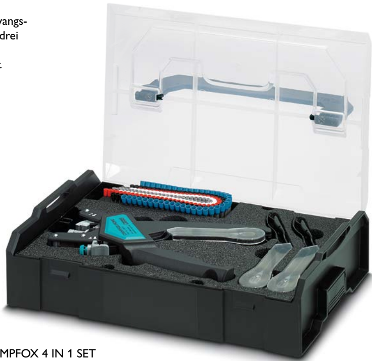
CRIMPFOX 4 IN 1 SET Art.-Nr. 1200102

Die CRIMPFOX 4 IN 1 vereint vier Funktionen in einem Werkzeug: Schneiden, Abisolieren, Verdrillen und Verpressen. So können Sie Aderendhülsen in gegurteter Form zeitsparend und komfortabel verarbeiten.