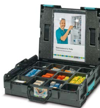
CASE PTFIX L-BOXX REV2 DE Art.-Nr. 1164787