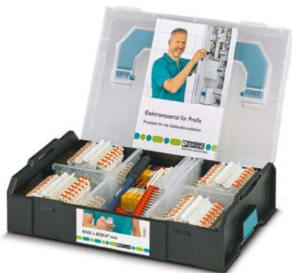
CASE KNX L-BOXX MINI DE Art.-Nr. 1180883