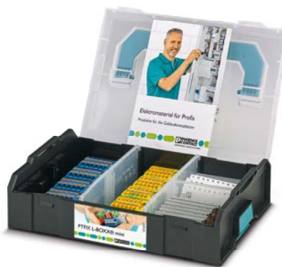
CASE PTFIX L-BOXX MINI DE Art.-Nr. 1182117