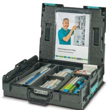
CASE PTI INSTA L-BOXX DE Art.-Nr. 1185519