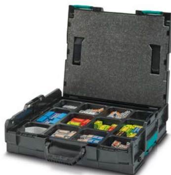
CASE PTFIX L-BOXX DE Art.-Nr. 1092040