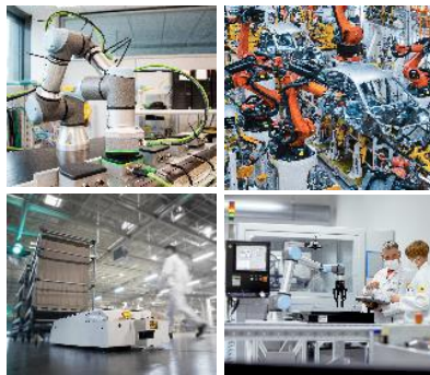
小型ロボットのツールチェンジ、搬送システム、AGV/AMR、クリーン環境などに活用