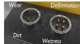
繰り返し挿抜によるピン曲がり・接触不良など、接続部トラブルを非接触接続により軽減