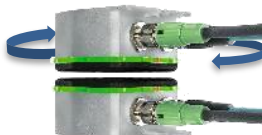
回転しながらの接続も可能