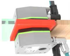
ガラス・樹脂・木材など、非金属を挟み込んだ環境にも対応