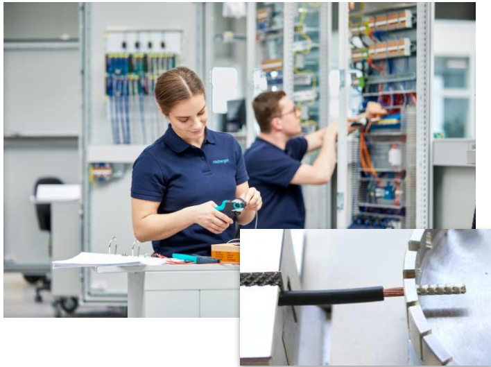
引張試験イメージ

フエニックス・コンタクトでは、圧着工具の高い圧着品質を保つため、5000回圧着ごと、もしくは1年に1度のどちらか短い方のタイミングで校正（引張試験）を行うことを推奨しています。定期的なメンテナンスで圧着作業の信頼性を向上させ、製造現場のトレーサビリティを確立します。