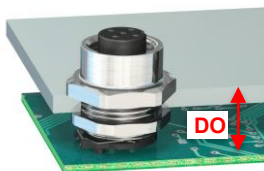
前面取付けハウジング