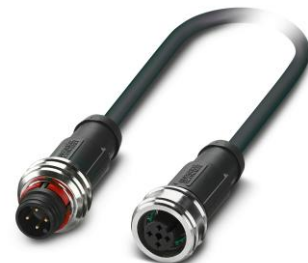
M12インナー-push-pullケーブルコネクタ